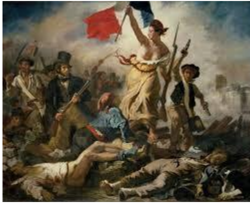
La Libertad guiando al Pueblo, Delacroix.

-Me gustaría tener una obra bizantina importante. Si fuera posible, me gustaría tener un mosaico de Ravenna. Me impactaría tener una obra de Botticelli, El nacimiento de Venus o La coronación de la virgen . La modelo de ambas obras es la misma, esto demuestra la maestría de un artista, pasar del erotismo más expuesto a la santidad. Otra obra que me gustaría tener es La libertad guiando al pueblo , de Delacroix.